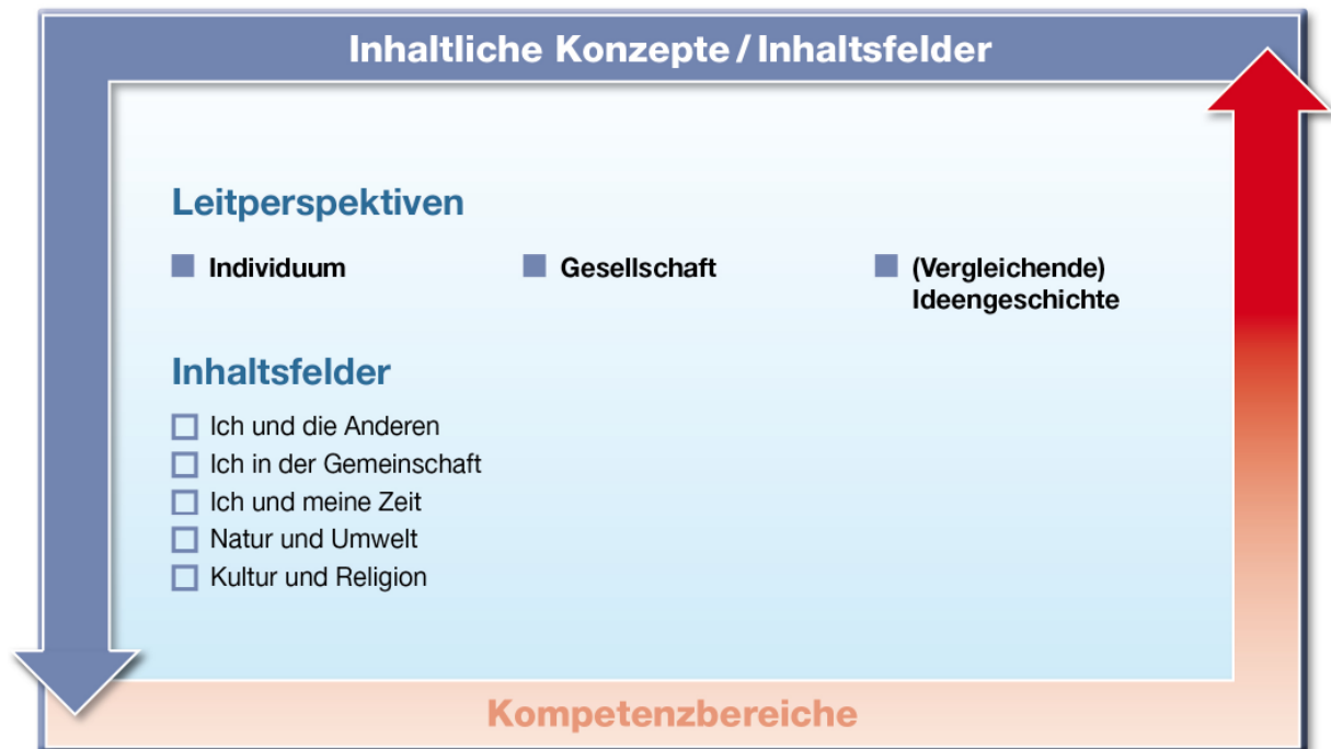
Abb. 2: Leitperspektiven und Inhaltsfelder

Die Inhaltsfelder richten sich an den Leitperspektiven des Faches Ethik – Individuum, Gesellschaft, (Vergleichende) Ideengeschichte – aus. Die Leitperspektiven stellen fachliche Konzepte dar, die sich auf die Systematik des Faches beziehen und das gesamte Spektrum der Wissens Elemente abdecken. Die Inhalte eines Faches werden durch Inhaltsfelder und Leitperspektiven sinnvoll strukturiert. Der Konzeptgedanke verdeutlicht die fachlichen Beziehungen.