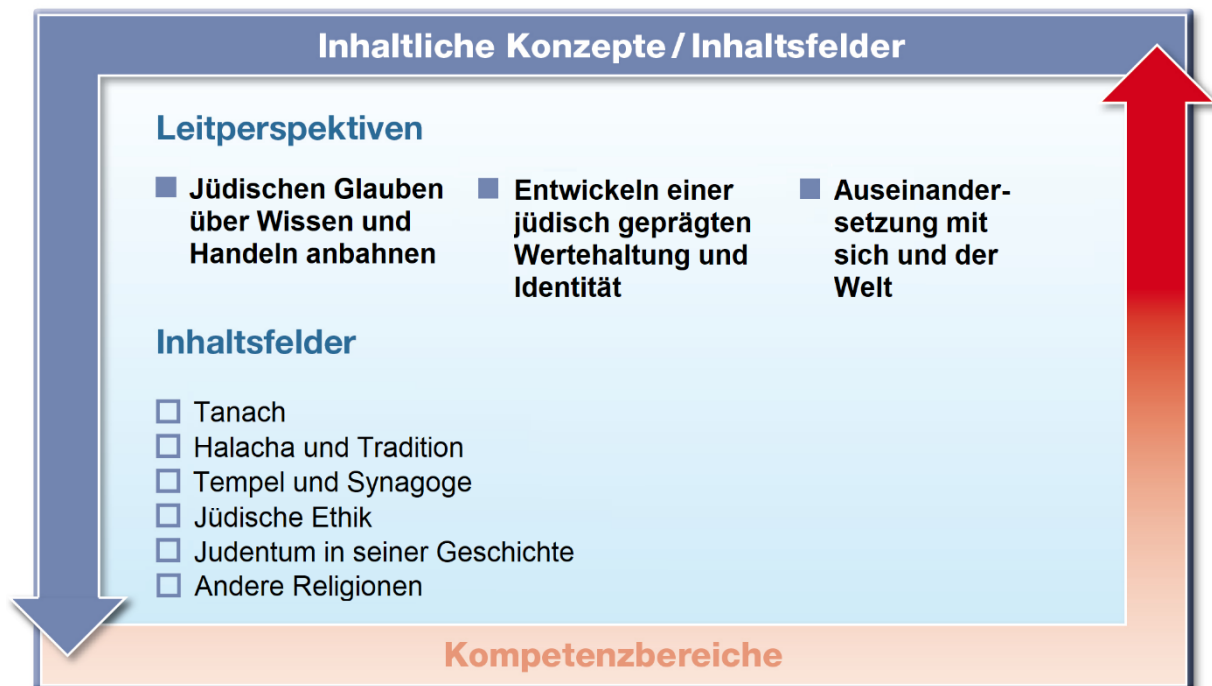
Abbildung 2: Leitperspektiven und Inhaltsfelder

Die Leitperspektiven stellen inhaltliche Konzepte dar, die sich auf die Systematik des Faches beziehen und das gesamte Spektrum der Wissens Elemente durchdringen. Diese Leitperspektiven entfalten wechselseitig sechs Inhaltsfelder, die die unverzichtbaren Wissensbestände des Faches darstellen.