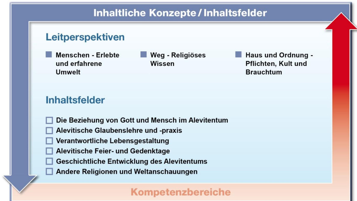
Abb. 2: Leitperspektiven und Inhaltsfelder im Fach Alevitische Religion

Für das Fach Alevitische Religion sind drei Leitperspektiven grundlegend, die abbilden, wie Religion Menschen in deren Lebenswirklichkeit begegnet: „Menschen“, „Weg“ sowie „Haus und Ordnung“.