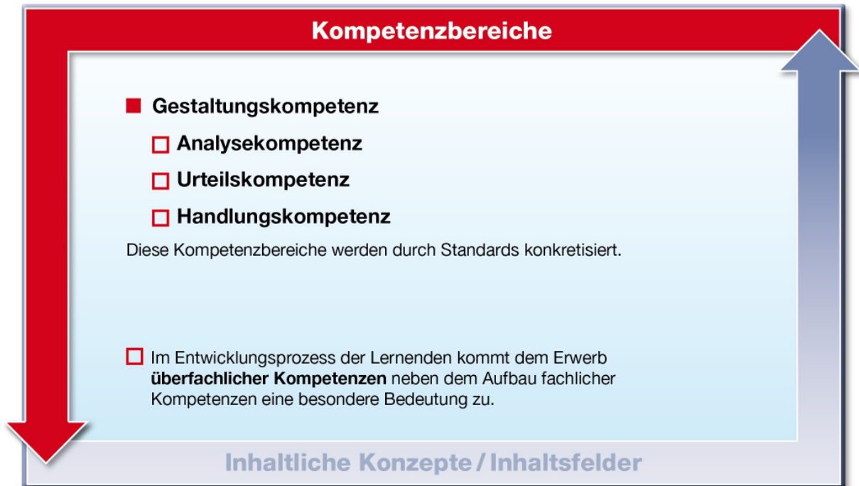
Abb. 1: Kompetenzbereiche im Fach Arbeitslehre

Arbeitslehre zielt auf eine Kompetenzentwicklung von Jugendlichen, die es ihnen ermöglicht, momentane und zukünftige Arbeits- und Lebenssituationen bedürfnisgerecht und (selbst-) reflektiert bewältigen und mitgestalten zu können.