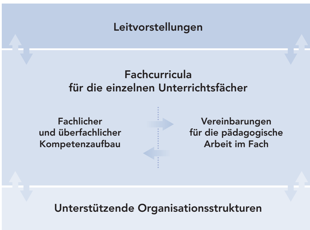
Abb. 1: Elemente des Schulcurriculums

Die schulinterne curriculare Entwicklungs- und Planungsarbeit hat das Ziel, das neue Kerncurriculum für Hessen in Form von Fachcurricula zu konkretisieren. Die Aufgabe der Fachkonferenzen bzw. Planungsgruppen in den einzelnen Schulen besteht darin, sich über die Leitlinien pädagogischen Handelns und den Kompetenzaufbau in den einzelnen Fächern – aber auch über die Fächergrenzen hinweg – zu verständigen, Vereinbarungen darüber herbeizuführen und diese zu dokumentieren. Die Fachcurricula sind die wesentlichen Elemente eines Schulcurriculums 1 .