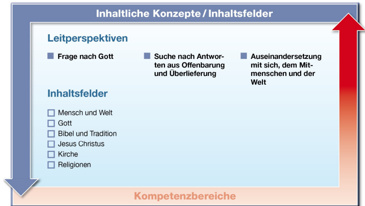
Abb. 2: Leitperspektiven und Inhaltsfelder im Fach Katholische Religion

Das inhaltliche Konzept des Faches Katholische Religion drückt sich in den Leitperspektiven „Frage nach Gott“, „Suche nach Antworten aus Offenbarung und Überlieferung“, „Auseinandersetzung mit sich, dem Mitmenschen und der Welt“ aus. Die Leitperspektiven erschließen sich in den sechs verbindlichen Inhaltsfeldern.