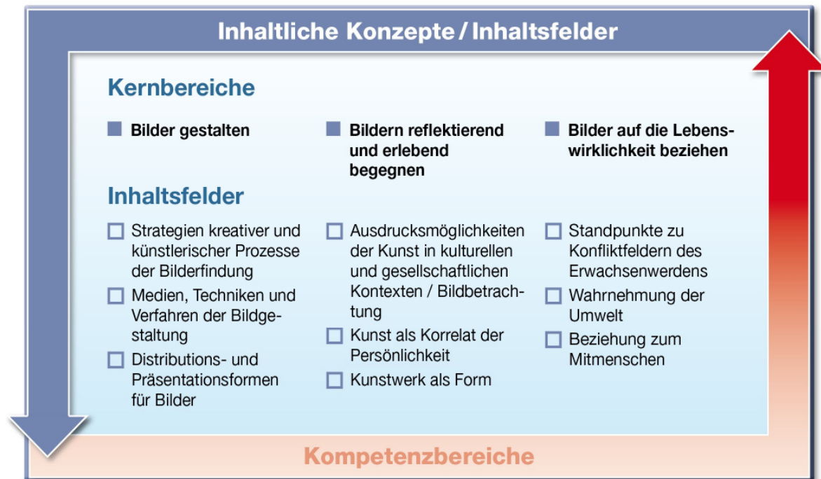
Abb. 2: Kernbereiche und Inhaltsfelder