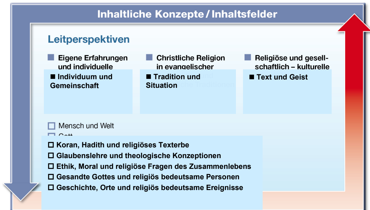
Abbildung 2: Leitperspektiven und Inhaltsfelder im Fach Islamische Religion

Für die an Kompetenzen orientierte unterrichtliche Strukturierung und Bearbeitung der Themen und Inhalte im Fach Islamische Religion werden diese fünf Inhaltsfelder auf drei Leitperspektiven bezogen. Während die Inhaltsfelder helfen, die Unterrichtsthemen etwa für die Erstellung der schulinternen Curricula zu konkretisieren, führen die Leitperspektiven gleichsam querliegend dazu drei Orientierungslinien für den Unterrichtsdiskurs ein. Sie bilden die Horizontlinien zwischen jeweils zwei kategorialen begrifflichen Oppositionen (siehe oben Kapitel 3). In diesem Sinne stellen sie fachwissenschaftliche Unterrichtsprinzipien (islamisch-theologische Kompetenzen) dar und helfen, die thematische Bearbeitung der Inhaltsfelder didaktisch-analytisch zu präzisieren. Die Leitperspektiven beruhen auf einem grundlegenden Konsens über die Grenzen unterschiedlicher theologischer Schulen des Islams hinweg. Ihre pädagogische Grundlage ist die lebensweltliche Funktionalisierung und Dynamisierung des Religionsbegriffs. Sie werden also nicht nur implizit angewendet, sondern explizit erarbeitet und gesichert: