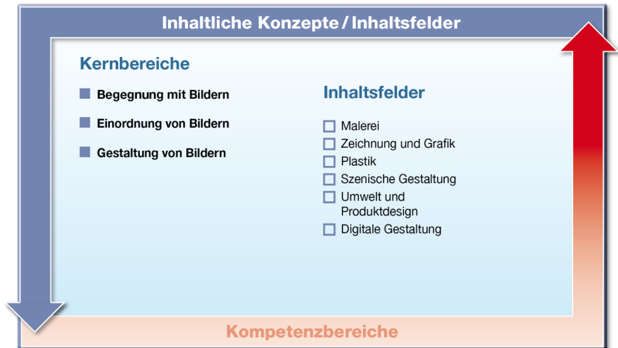
Abb. 2: Kernbereiche und Inhaltsfelder

Die Inhaltsfelder stehen in Bezug zu den Kernbereichen des Faches Kunst: „Gestaltung von Bildern“, „Begegnung mit Bildern“ und „Einordnung von Bildern“. Sie richten sich inhaltlich an ihnen aus und sind durch sie legitimiert.