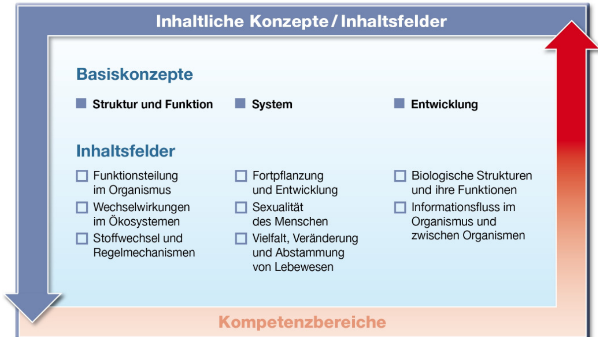
Abb. 2: Vernetzung der Kompetenzbereiche, Basiskonzepte und Inhaltsfelder

Die Breite der Fachwissenschaft Biologie mit ihrer ungeheuren Vielfalt und großen Anzahl von Einzelphänomenen zeigt in den letzten Jahrzehnten eine rasante Dynamik. In dieser Faktenfülle muss eine einsichtige Struktur geschaffen werden, die einerseits den Kern des biologischen Wissens repräsentiert und andererseits kumulatives Lernen arrangiert. Sie soll es dem Schüler ermöglichen, einmal Erkanntes auch auf neue Probleme zu übertragen. Im Unterricht ist daher exemplarisches Vorgehen notwendig, das vom Einfachen zum Komplexen hinleitet. Dies gelingt mit lebensweltlichen und sinnstiftenden Kontexten. Die Basiskonzepte vermitteln dazu nur einen Rahmen, in dem die in sich vernetzten Inhaltsfelder aufgehängt sind, sodass aus verschiedenen Kontexten heraus immer wieder Bezüge hergestellt werden können. Die Inhaltsfelder selbst beschreiben thematische Zusammenhänge, die sich einerseits aus dem biologischen Fachwissen ergeben, andererseits auf Fakten basieren, die man kennen muss, um sachgerecht eigene Lebenssituationen oder gesellschaftliche Fragen beurteilen und bewerten zu können. Die Basiskonzepte sind demzufolge themenverbindende übergeordnete Regeln, Prinzipien und Erklärungsmuster, die eine Vielzahl von unterschiedlichen Phänomenen miteinander vernetzen und sich im Laufe der gesamten Lernzeit zuerst herauskristallisieren und dann verknüpfen.