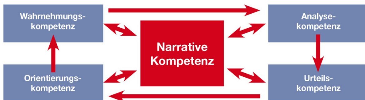
Abb. 3: Kompetenzen im Fach Geschichte

Die „Orientierungskompetenz für Zeiterfahrung“ beschreibt die Fähigkeit, in der Beschäftigung mit Geschichte einen Sinn für das eigene Weltverständnis zu sehen. Sie beruht auf dem Zusammenhang zwischen Gegenwärtigem und Vergangenem und verhilft dazu, den Einfluss historischer Zusammenhänge auf die Gegenwart, auf aktuelle Ereignisse und Entwicklungen zu erklären. Sie befähigt zur Einordnung von Faktenbeständen sowohl in einen thematischen bzw. sachlich-analytischen als auch in einen chronologischen Zusammenhang. Geschichte kann als notwendiges Instrument erkannt werden, um die historische Bedingtheit gegenwärtiger Sachverhalte und Phänomene zu verstehen und die eigene Lebenswirklichkeit zu erklären. Sie ermöglicht es, das eigene Tun und Lassen plausibler zu begründen. Außerdem verhilft sie dazu, in aktuellen Diskussionen die eigenen Einstellungen, Vorurteile, Haltungen, Deutungsmuster und Wertmaßstäbe in den Geschichtsunterricht einzubringen, diese zu reflektieren und kritisch zu hinterfragen. Aus der Kenntnis von Zwängen und Freiheiten, denen historische Entscheidungen unterlagen, können Handlungsspielräume für die Bewältigung der Gegenwart und die Gestaltung der Zukunft benannt werden. Somit verhilft die Orientierungskompetenz letztlich zu ethisch verantwortlichem Handeln. Diese Kompetenz führt zu eigenen Werturteilen.