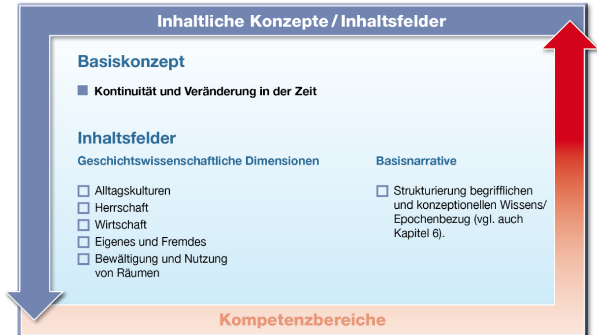
Abb. 4: Inhaltsfelder und Basiskonzept

Das Basiskonzept und die Inhaltsfelder helfen den Lernenden dabei, sich im Universum der Geschichte zurechtzufinden, damit sie die historischen Kompetenzen ausbilden können. Außerdem können diese Zugriffsweisen bei der Erstellung von Schulcurricula und der Generierung von Unterrichtsthemen dienen.